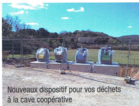
Nouveaux dispositifs pour vos déchets à la cave coopérative

Notre commune a été choisie comme commune pilote et le personnel de l'agglomération viendra à la rencontre de la population d'ici à l'été pour expliquer le fonctionnement, comprendre les nombreuses spécificités et répondre à vos questions.