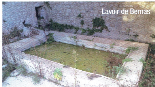
Lavoir de Bernas

NOTRE PETIT PATRIMOINE - On dénombre cinq lavoirs sur le territoire de la commune répartis en fonction de la distribution de l'habitat et des sources d'eau. Il n'y en a pas à Montclus même parce que le village borde la rivière avec ses plages de galets et ses rochers propices à la lessive. Le lavoir de Linde, à un kilomètre du hameau, a été construit vers 1850, par un architecte, à un niveau plus élevé que la source ! Toujours à sec, il a nécessité de nouvelles dépenses pour abaisser le bassin ! Aujourd'hui, il menace de s'écrouler.